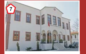
Belediye Hizmet Binası