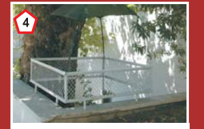
Şemsi Ana Mezarı