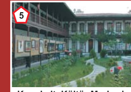
Konakaltı Kültür Merkezi